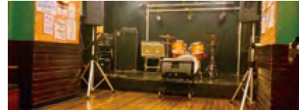
ガラパゴススタジオ

お陰様で今年40周年を迎える事が出来ました。リハーサルスタジオは全6室(¥1180~¥2880)30畳のガラパゴススタジオでは、お客様の主催ライブは勿論、その他ダボスタ主催ライブ、サークルセッション、ジャズセッション等々を催しています!各種パートのレッスンも受け付けておりますまた、コロナ禍では特にレコーディングがダントツの人気で沢山のお客様がレコーディングして下さいます!無料駐車場有り(要予約)