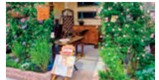
エントランスイメージ