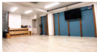
フレキシブルな自由空間です！

皆さまの活動のお役に立てましたら幸いです！是非お気軽にお問い合わせくださいませ。