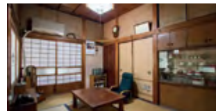
昭和の雰囲気の一部屋も

敷地面積約300坪。静かな住宅地に立つ築約70年の昭和の家を、多目的のハウススタジオとしてお使いいただけます。撮影スタジオとしてはもちろん、展示会やワークショップの会場などとしてもご利用可能です。リノベーション等は一切行っていないため、一部に雨漏りの跡、床のきしみ、建具のゆがみなどがございますが、築年数の経過とともに醸し出された風合いとご理解ください。板橋区で活動されている方は特別料金でご利用いただけますのでお問い合わせください。