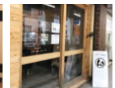
time spot 外観