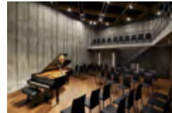
マリーコンツェルト

永田音響設計による音響シュミレーションによって導かれた音楽の為の特別な空間は、100席あまりが収容でき、最高天井高約6.3mのおおらかな音楽空間です。クラシックのコンサートは勿論、その他、ご自由にレイアウト等工夫して頂き、様々なコンサートやイベントなどにお使いいただけるだけでなく、練習や動画撮影のみのご利用も可能です! 料金は用途によって変わりますので、詳しくはホームページからご確認ください。皆様のお越しを心よりお待ちしております。