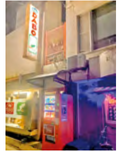
ダボスタジオ外観