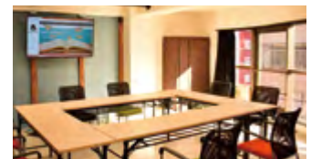
ミーティング、セミナーにも！