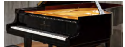
スタインウェイ B-211 グランドピアノ