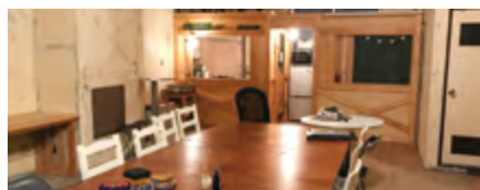
time spot 内観

time spotは空き家を活用し、クリエイターと地域の接点をつくるスペースで「openなんだけど秘密基地」をコンセプトに、子どもも大人も遊び、学ぶ場として、様々なスクールやイベントを開催しています。またワーキングやワークスペースのシェアも行っています。働き方も多様化する今、実験の場として、ぜひお使いください。料金は会員価格¥1,000/1h、ビジター価格¥2,500/1h。年会費¥5,000で1年間、会員料金でご利用頂けます。テーブル・椅子20脚/プロジェクター/オーディオ/キッチン/Wi-Fi等完備。