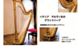
ゆらぎ掲示板 ハープ